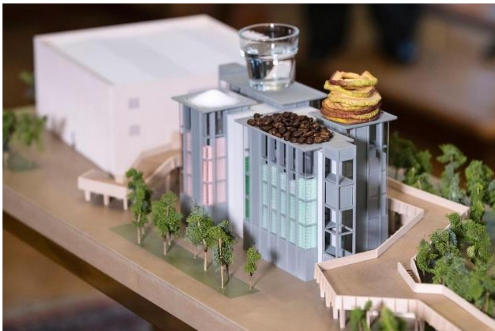
Un modellino del padiglione svizzero per l'Expo di Milano 2015

Expo mondiale a Milano dal 1° maggio al 31 ottobre 2015.